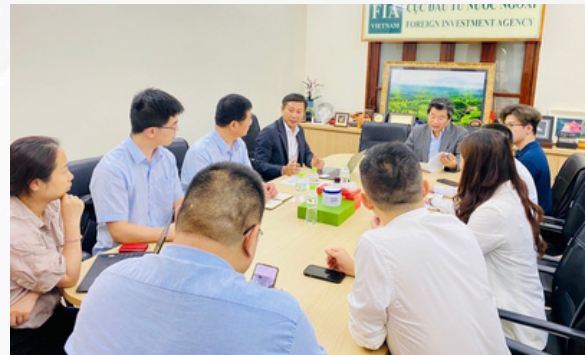
Buổi làm việc với Tập đoàn Sunrise tại Cục đầu tư Nước ngoài