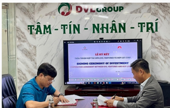
Lễ ký kết hợp tác với Tập đoàn Hợp Lực