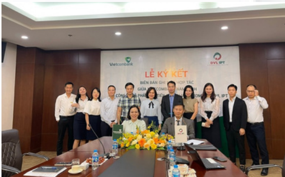
Lễ ký kết hợp tác với Ngân hàng Vietcombank