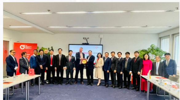
Xúc tiến mở rộng cơ hội đầu tư cùng đoàn tinh Nam Định tại Châu Âu