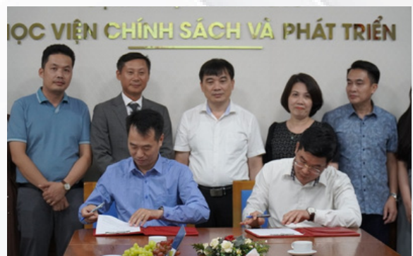
Lễ ký kết hợp tác với Học viện Chính sách và Phát triển