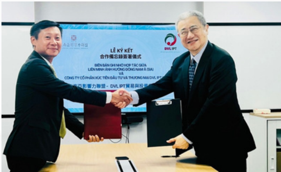
Lễ ký kết hợp tác với Liên minh ảnh hưởng Đông Nam Á