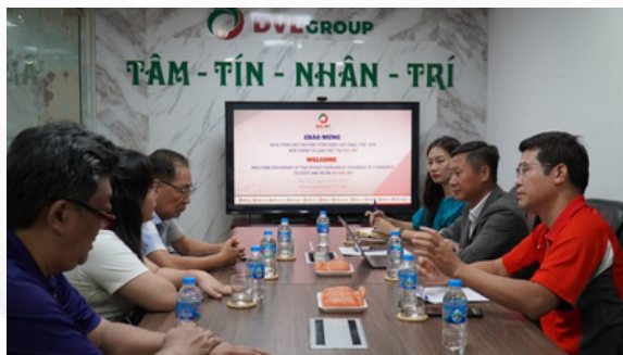
Gặp gỡ và làm việc với Ngài Tổng hội trưởng Tổng hiệp hội TMDL Thế giới