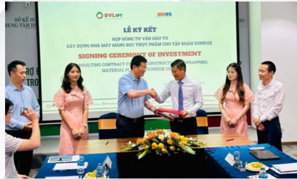
Lễ ký kết hợp đồng với Tập đoàn Sunrise